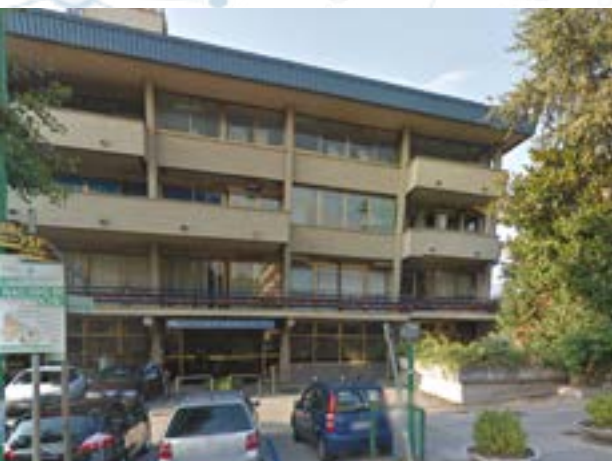
Hub e Spoke: Diagnostica Medica s.r.l. LABORATORIO ANALISI Via Nazionale, 146 83013 Mercogliano

la nostra rete di laboratori per rispondere alle esigenze dei nostri pazienti