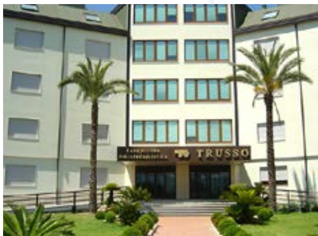
Spoke: Casa di Cura Trusso CARDIOMED S.P.A. UNIPERSONALE LABORATORIO ANALISI Via San Giovanni Bosco, 3 80044 Ottaviano (NA)